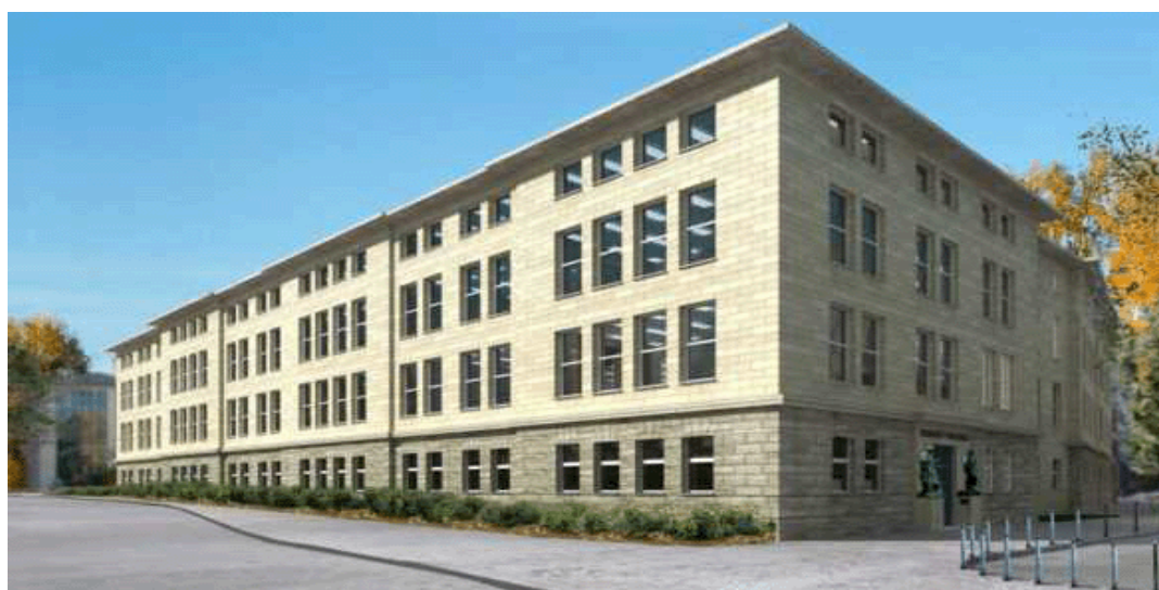
شکل ۵: تصویر انیستیتوی متالورژی استخراجی آهن در دانشگاه صنعتی آخن.

در بین انیستیتوهای تخصصی متالورژی و مواد، انیستیتو متالورژی استخراجی آهن بزرگترین آنها می باشد