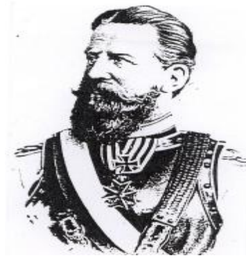
شکل ۲: تصویر شاهزاده فریدریک سوم ولیعهد پروس (۱۸۳۱ تا ۱۸۸۸ میلادی).

سازماندهی جدید دانشگاه صنعتی آخن با کمک مادی شاهزاده فریدریک سوم، ولیعهد پروس (۱۸۳۱ تا ۱۸۸۸ میلادی) بر اساس برنامه پلی تکنیک پاریس، انجام شد. تصویر شاهزاده فریدریک سوم ولیعهد پروس در شکل (۲) نشان داده شده است.