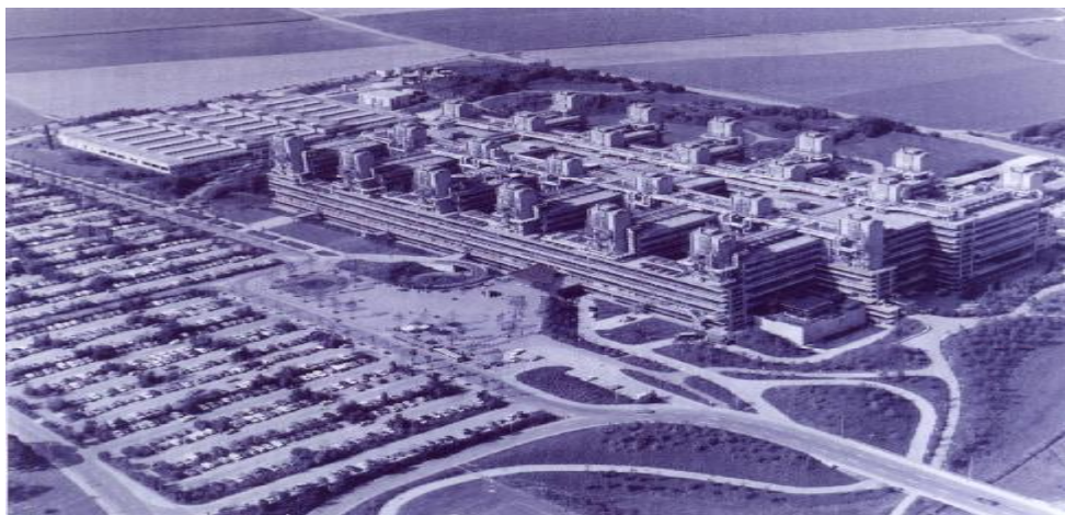
شکل ۴: تصویری از دانشکده پزشکی دانشگاه صنعتی آخن در سال ۲۰۰۱ میلادی.