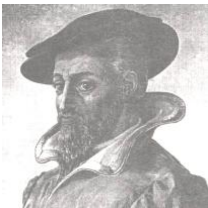
شکل ۱: تصویر جورج آگریکولا (۱۴۹۴ تا ۱۵۵۶ میلادی).

تاریخچه بنیانگذاری دانشگاه صنعتی آخن با تاریخچه صنایع این منطقه از آلمان در نیمه دوم قرن نوزدهم میلادی، هماهنگ است. آخن در مرز بین آلمان با هلند و بلژیک و در نزدیکی لوگزامبورک و فرانسه قرار دارد. احداث دانشگاه صنعتی آخن با احداث دانشگاه های صنعتی در اروپا در قرن نوزدهم کم و بیش همزمان بوده